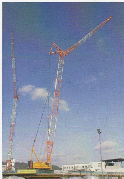
岡山市民病院(平成25年)120t