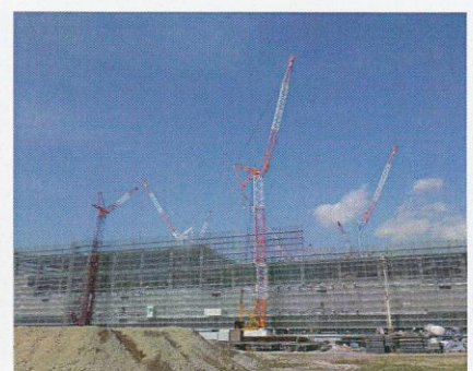
総社プロジェクト(平成27年)120t