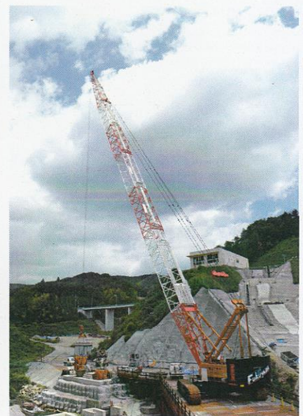
野間川ダム(平成24年)200t