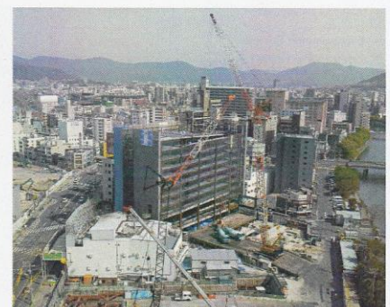
広島Bブロック(平成26年)120t・90t