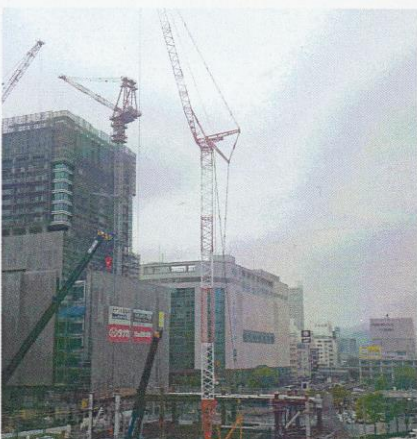
広島Cブロック(平成28年)120t